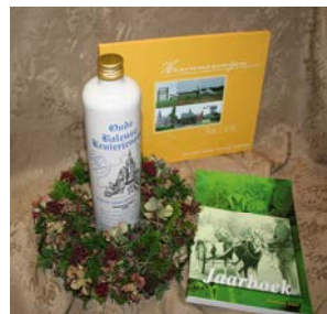
Geef een stukje Balen cadeau

Telefoon: 014 81 37 73 E-mail : info@erfgoedbalen.be website : www.erfgoedbalen.be Reknr : BE07-652-8040120-66