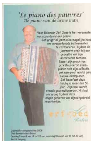
Affiche Balen Jaarmarkt